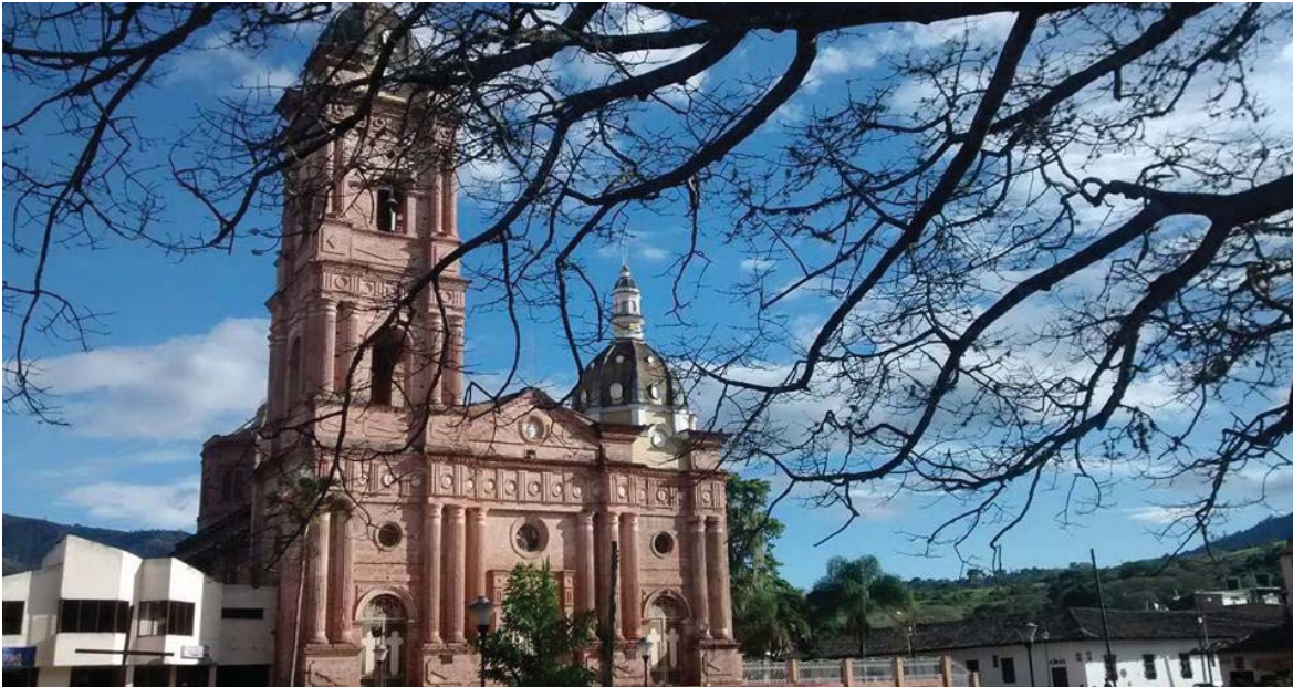
Figura 1. Parque central del municipio