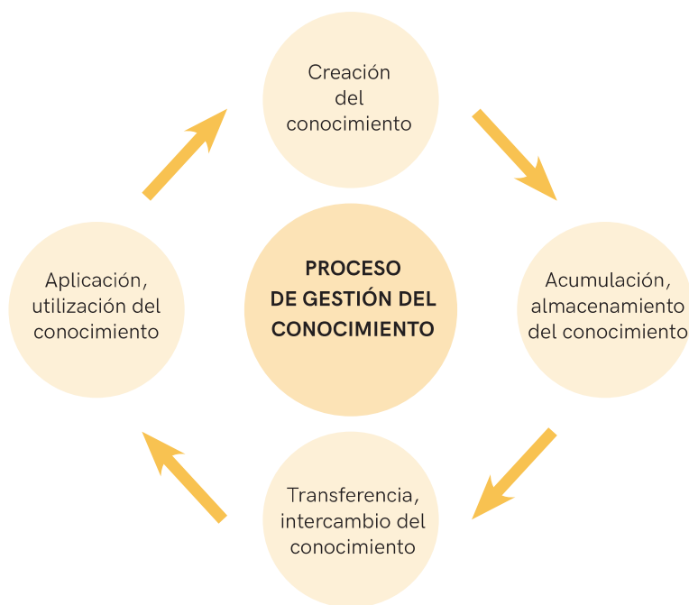
Figura 1. Proceso de gestión del conocimiento