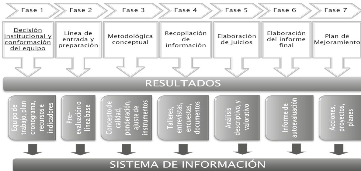
Gráfica 1. Modelo Autoevaluación Institucional – UAN.