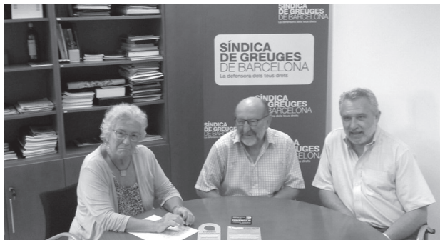
Figura 6. Reunión de representantes de #EnsPlantem con la Síndica de Greuges (05-08-2016).

Los resultados de ésta y otras acciones fueron satisfactorios pues el 27 de enero de 2017, el Pleno Municipal aprobaba el Pla Especial Urbanístic d'Allotjaments Turístics (PEUAT), el cual consideraba al barrio del Poblenou como Zona 1, esto es, aquella donde no se permite la implementación de ningún nuevo tipo de establecimiento turístico ni la ampliación de plazas de los establecimientos existentes 32 .