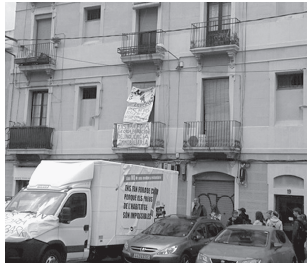
Figura 5. La mudanza de protesta en el Poblenou (10-05-2018).