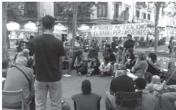
Figura 7. Asamblea-cena de #EnsPlantem en la Rambla (14-06-2016).

“el hecho de que al pasear la Rambla y escuchar a la gente hablar en inglés, y están de paso, pues ves una ocupación del espacio público que no es de la gente que vive en el barrio, sino que están de paso y vienen a consumir la ciudad y el barrio...”