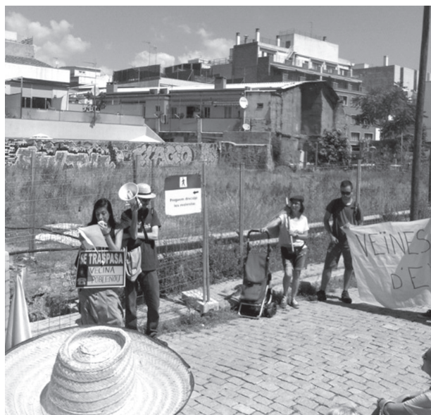
Figura 3. La Ruta de l'Especulació a su paso por uno de los antiguos huertos (05-06-2016).

Entre las primeras decisiones que tomó la plataforma #EnsPlantem estuvo la realización de una serie de acciones en el espacio urbano del barrio con el objetivo de hacer visible las reivindicaciones planteadas. En este sentido se convocó, para el 5 de junio de 2016, lo que se denominó una “Ruta de l'Especulació” (Ver Figura 3). Ésta consistió en un pasacalle que recorrió diversos emplazamientos del Poblenou considerados como especialmente relevantes para los miembros de la asamblea. Entre los mismos se encontraron espacios que, en breve, acogerían establecimientos hoteleros, así como antiguos solares convertidos en huertos urbanos, como el denominado Hort Indignat 1 18 , espacio ocupado por la extinta Asamblea Social del Poblenou (ASP9), heredera del movimiento 15M en el barrio, y que pertenecía al denominado SAREB (Sociedad de Gestión de Activos procedentes de la Reestructuración Bancaria) o Banco Malo , esto es, el organismo constituido por el Gobierno del Estado para adquirir activos inmobiliarios pertenecientes a entidades financieras en proceso de saneamiento.