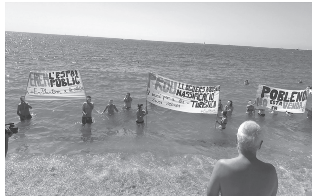
Figura 9. Acto de protesta en la playa de la Marbella (09-07-2017). Fuente: @EnsPlantemP9

sado con su incremento en la parte superior de la misma, esto es, entre Pere IV y Diagonal. Esta es la razón por la que hay una aparente disminución en el número de mesas, sillas y superficie, pero un mantenimiento del número de licencias.