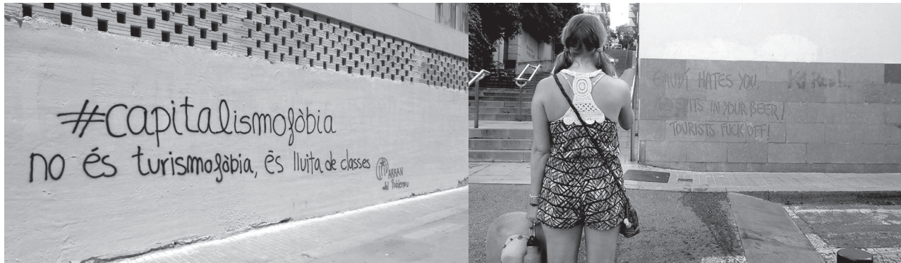
Figura 1. Grafitis en los barrios del Poblenou y Vallcarca (19/06/2018 y 30/07/2018)

ejemplo, el papel de plataformas como Airbnb en el tejido social de la ciudad, sino también encuentros internacionales y debates propositivos sobre esta cuestión 9 , es posible afirmar que la interrelación entre turismo y ciudad tomó un impulso notorio definitivo durante la campaña turística de 2017 (Mansilla, 2018a).