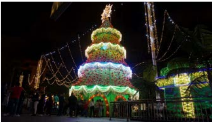
Parque Principal de Envigado con intervención del alumbrado navideño.