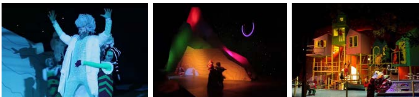
Imágenes tomadas del canal Compañía de Galletas Noel (marzo 1 de 2020): Un maravilloso viaje de Navidad [archivo de video]. Youtube. https://www.youtube.com/watch?v=Axul8M1sk1w . De dos escenas del espectáculo, de izquierda a derecha imagen: escenas de la montaña de los siete colores y la de El Lago de las Casas Zancudas .