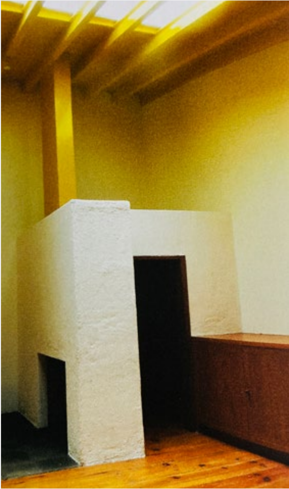
Chimenea, elemento que ayuda a bloquear la vista directa al estudio, estudio de Luis Barragán.