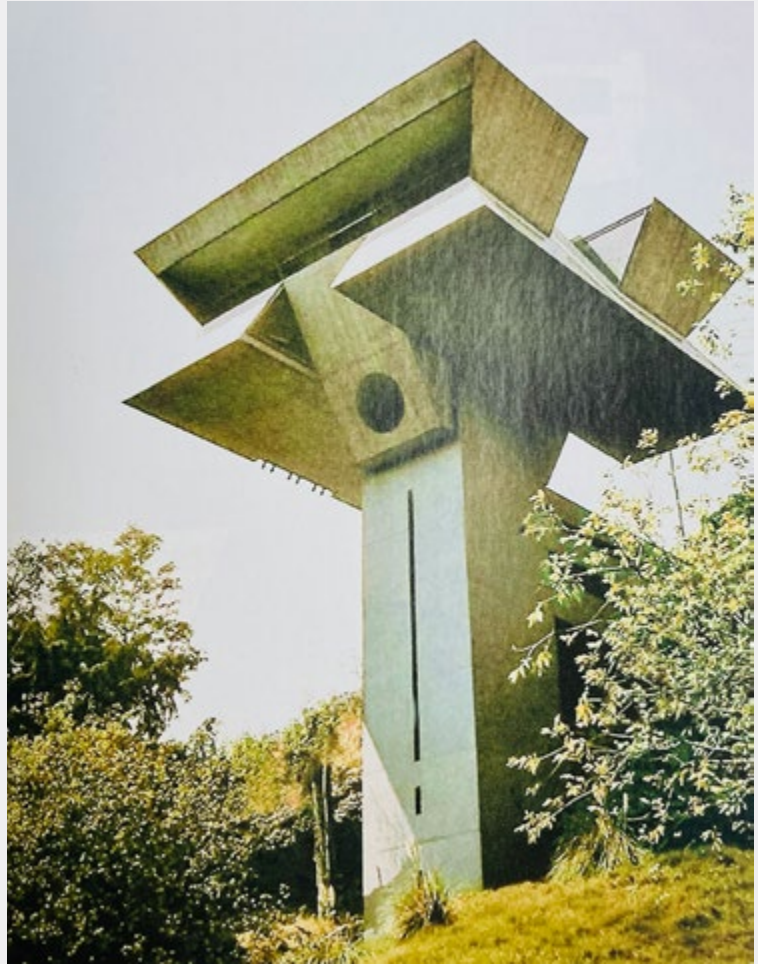
Taller de arquitectura de Agustín Hernández, Ciudad de México 1976.