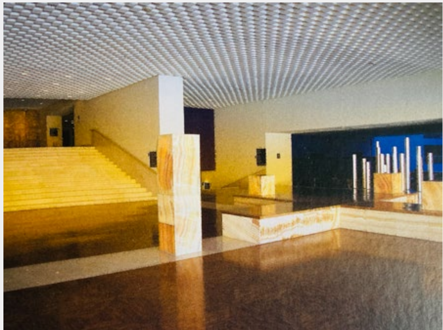
Ricardo Legorreta, lobby del Hotel Camino Real, 1968, Ciudad de México.

La sensación de cambio social que se respiraba en la nación favoreció el desenvolvimiento de un