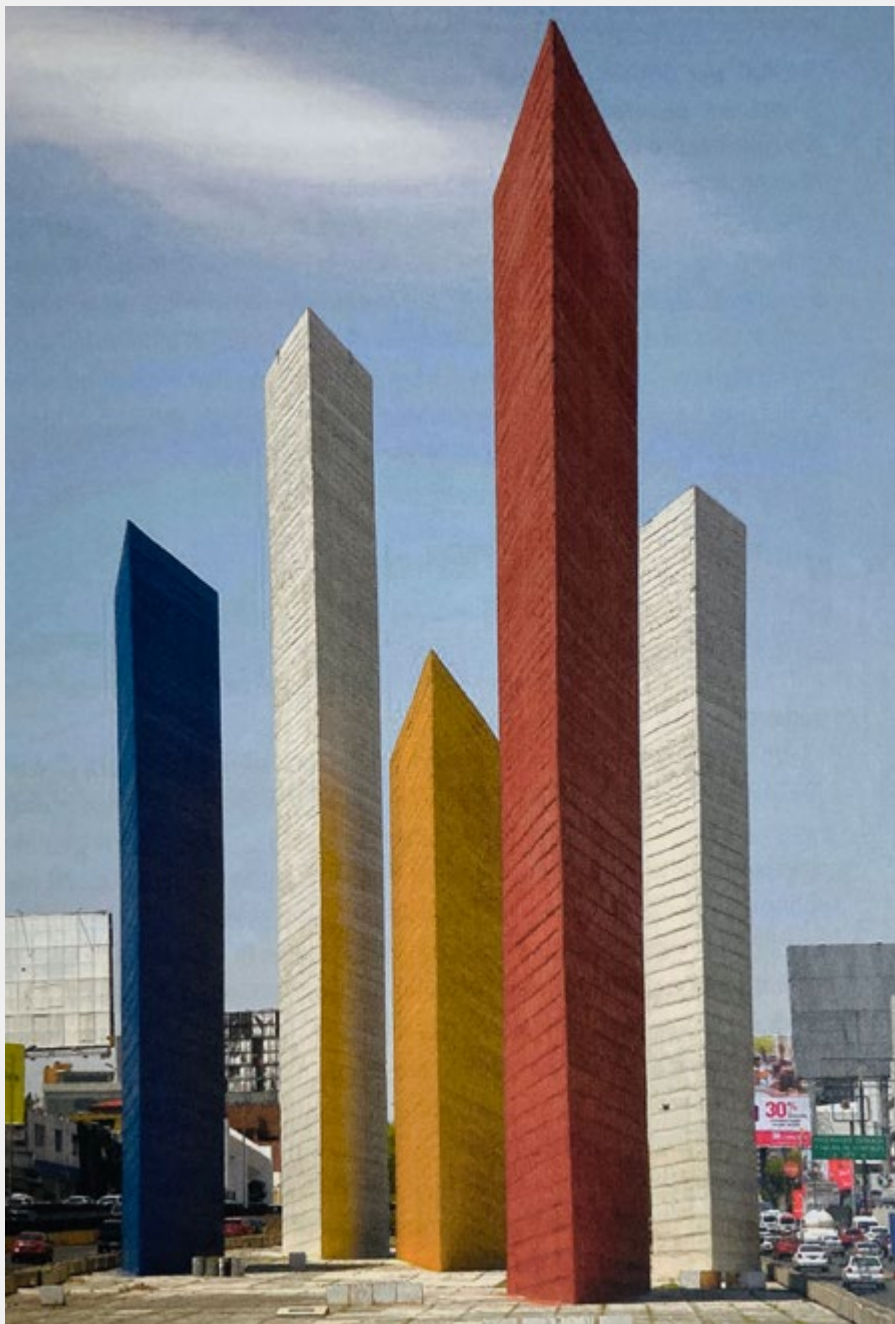
Luis Barragán y Mathias Goeritz, Torres de Satélite, 1957, Ciudad de México.

La búsqueda implacable de una identidad visual inicia desde un lugar en el que México busca formar parte de los discursos occidentales, pero lo hace desde una posición condicionada cuyos estándares son