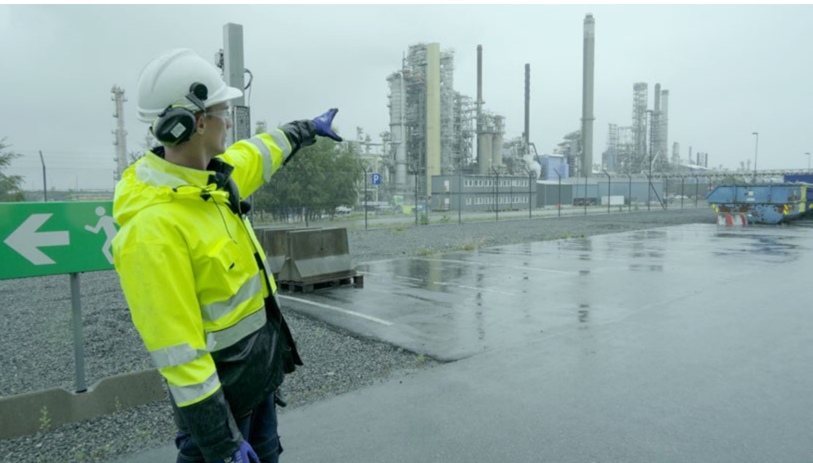
Oliver Ressler, Carbon and Captivity , video 4K, 33 min., 2020