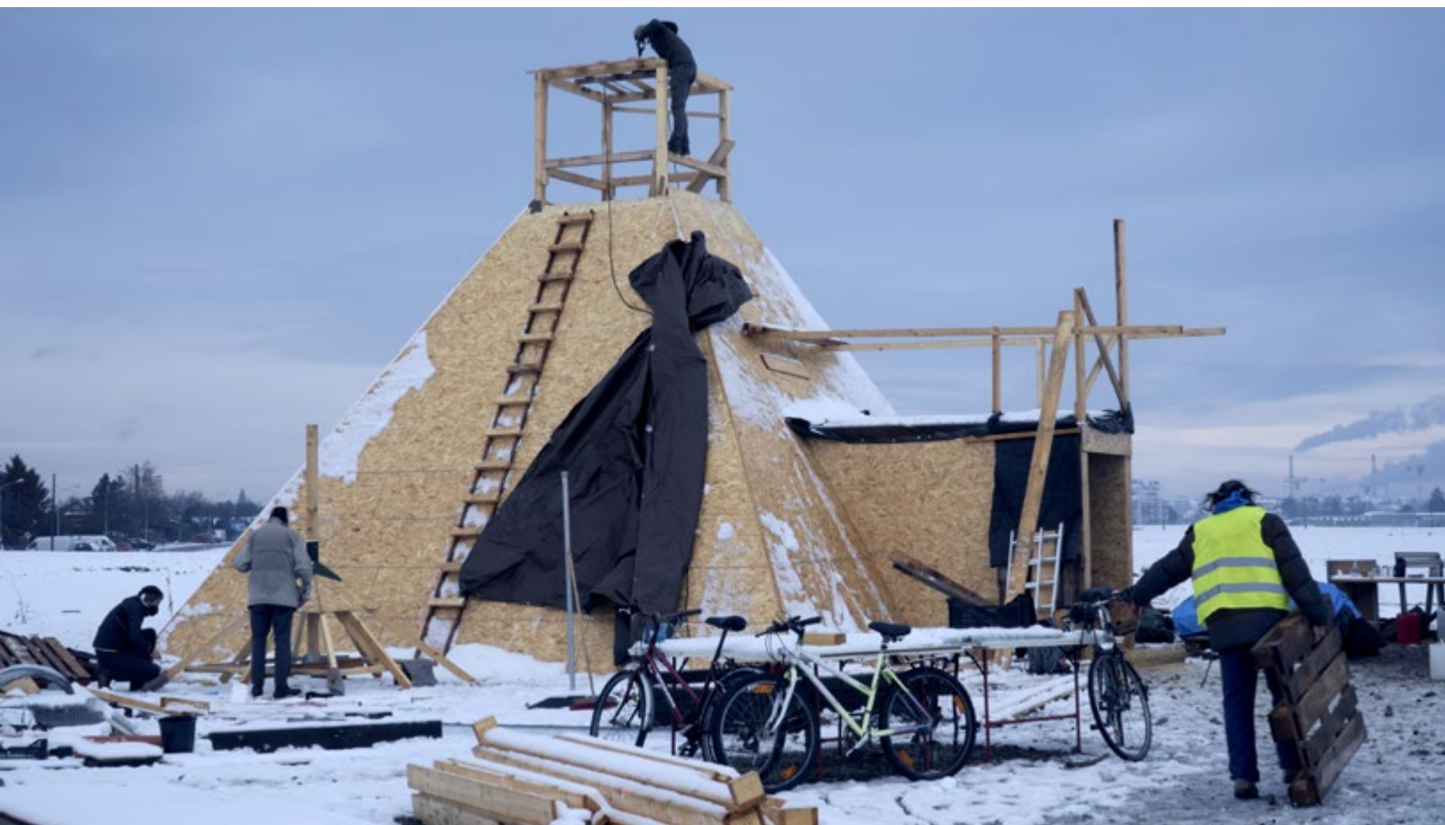
Oliver Ressler, The Desert Lives , video 4K, 55 min., 2022