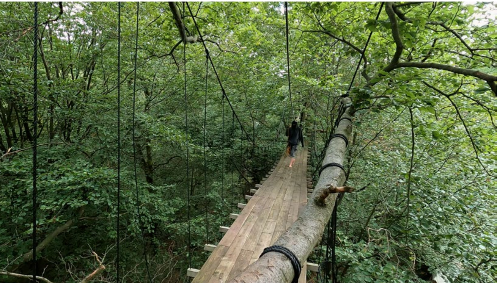
Oliver Ressler, The Path is Never the Same , video 4K, 27 min., 2022