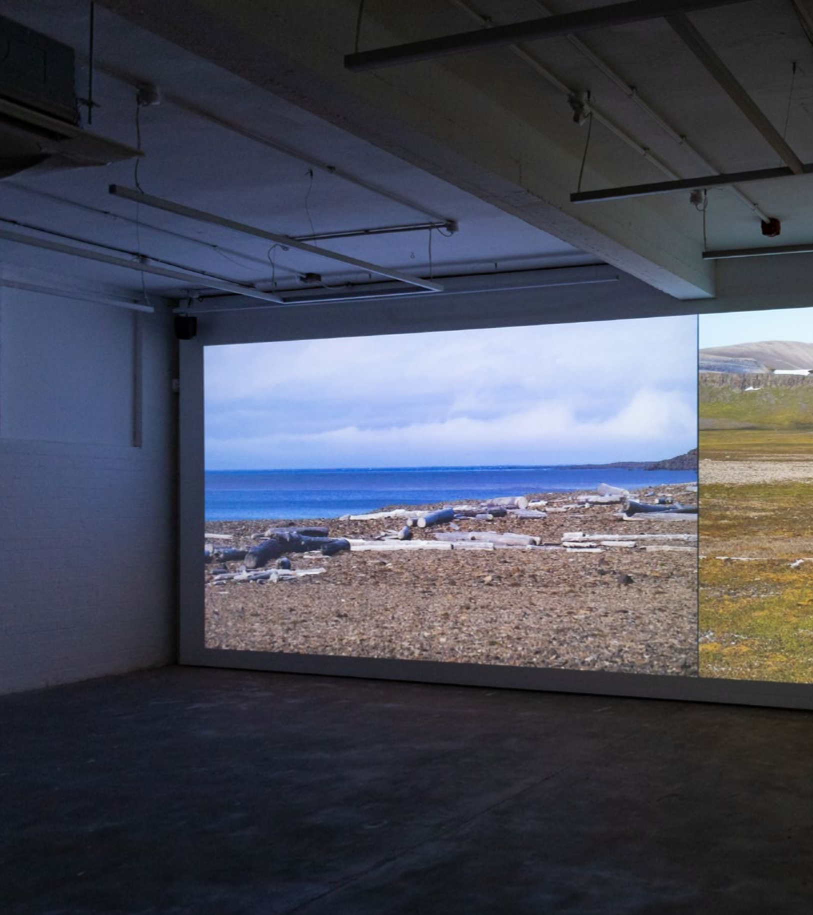
Oliver Ressler, Climate Feedback Loops , videoinstalación de dos canales, videos 4K, 23 min., 2023. Vista de la exposición en Humber Street Gallery, Hull, 2023.