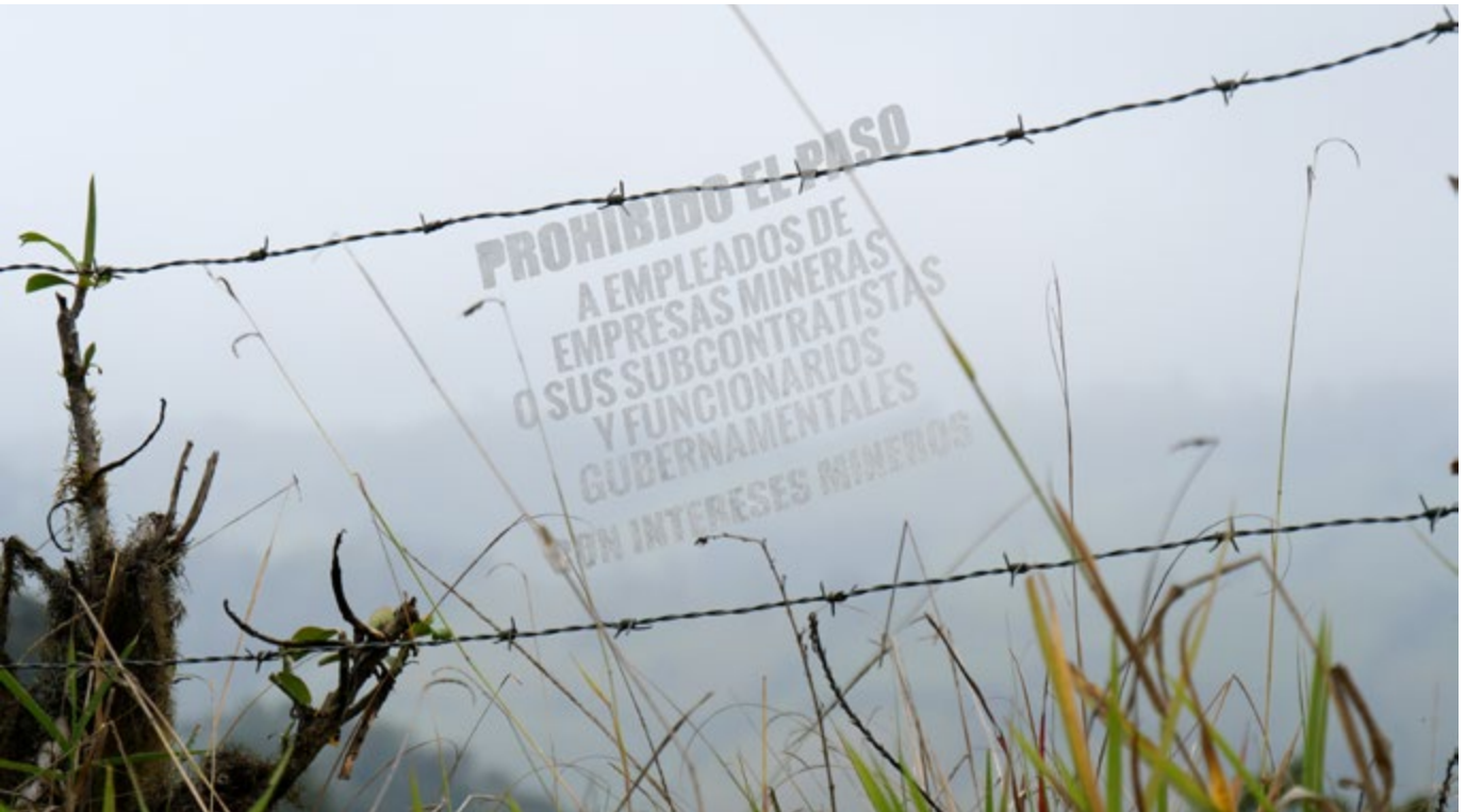
Oliver Ressler, Ancestral Future Rising , video 4K, 20 min., 2023