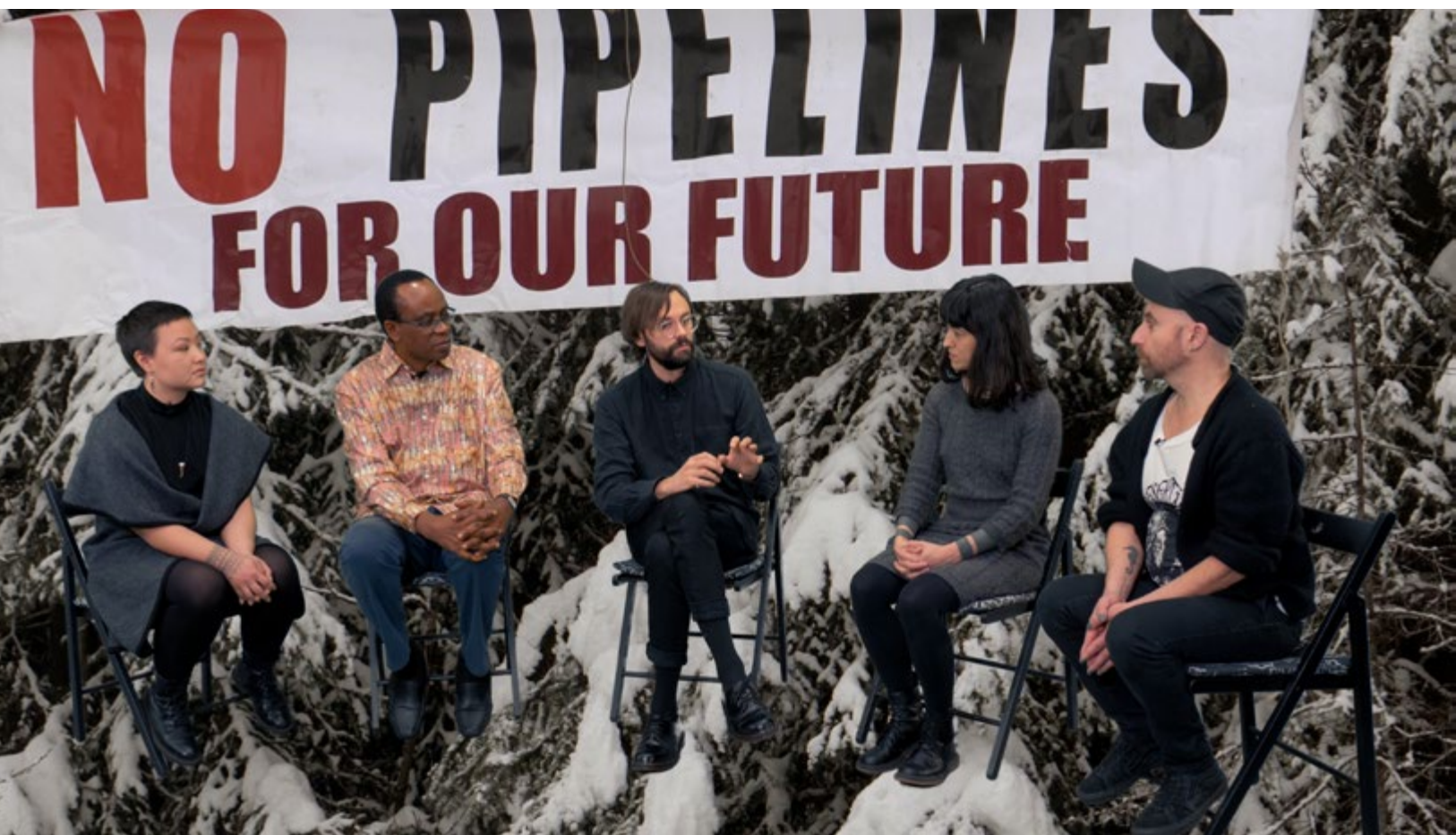
Oliver Ressler, Barricade Cultures of the Future , video 4K, 40 min., 2021