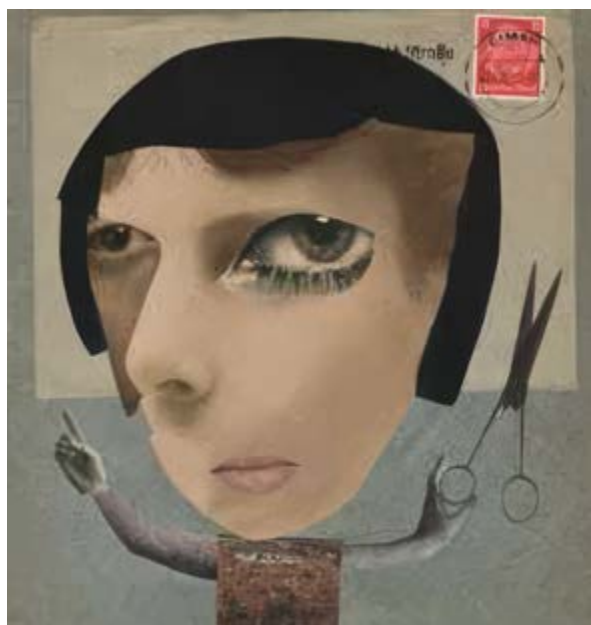
Figura 5 | Hannah Hoch, La hermosa chica , collage, 1920. https://historia-arte.com/artistas/hannah-hoech