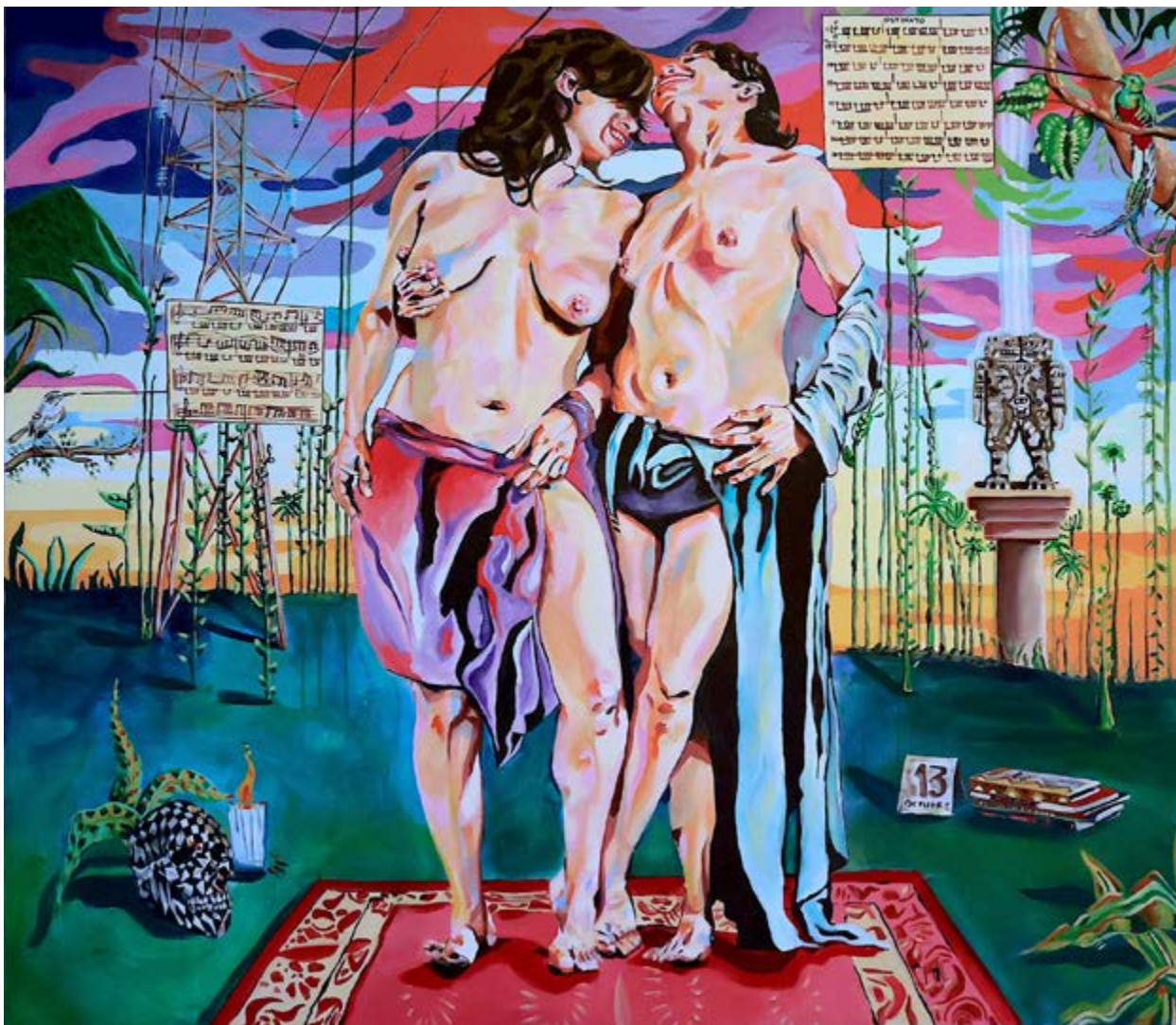
Figura 10 | Lila Jamieson, Canto, maridaje musical: Bolero de Maurice Ravel , de la serie Happy Painting , acrílico / lienzo, 130 × 150 cm, 2020.

No desde la necesidad de activar el placer visual hegemónico, sino a través de la inserción de nuestra comunidad en la cotidianidad, en su fuerza, su ternura, su filosofía y su vida.