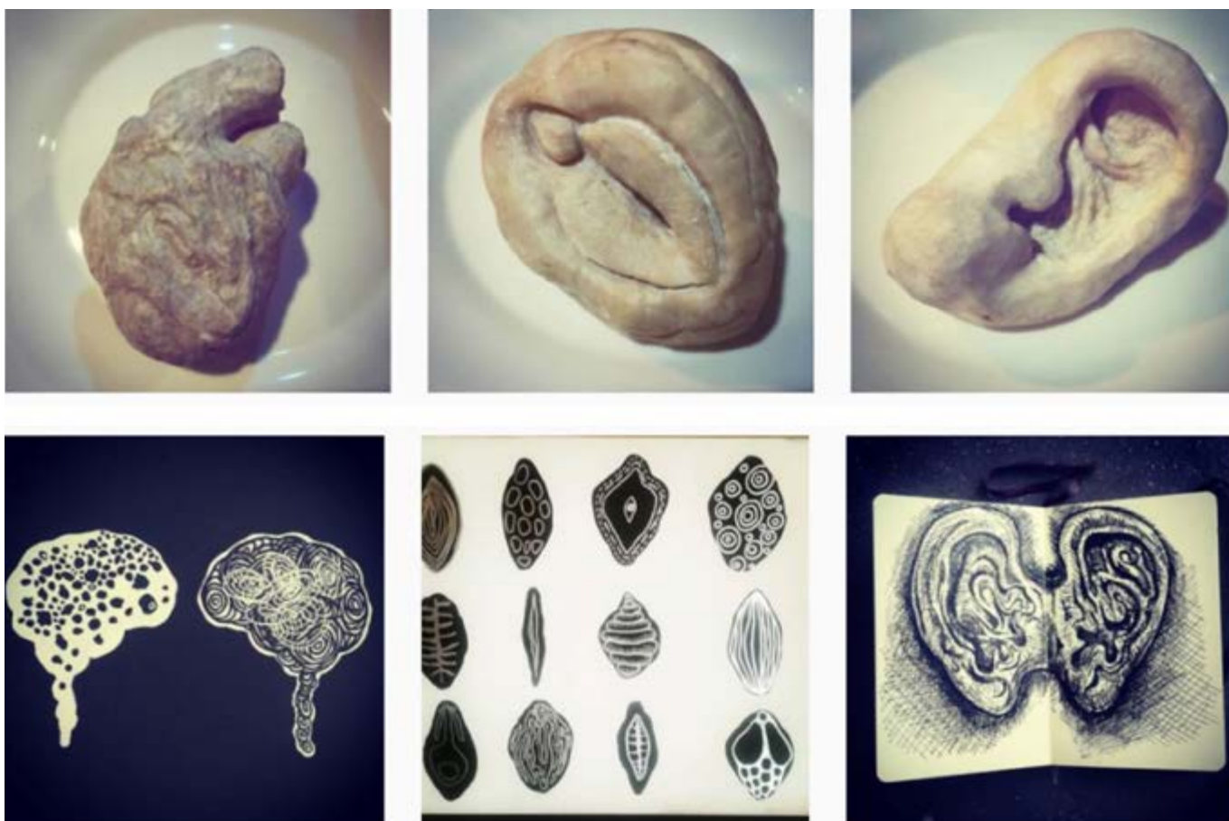
Figura 9 | Larisa Escobedo, La cuerpo y sus formas orgánicas , talla directa en mármol y gráfica, 2020. Imagen cortesía de la artista. https://www.instagram.com/escobedo.larisa/