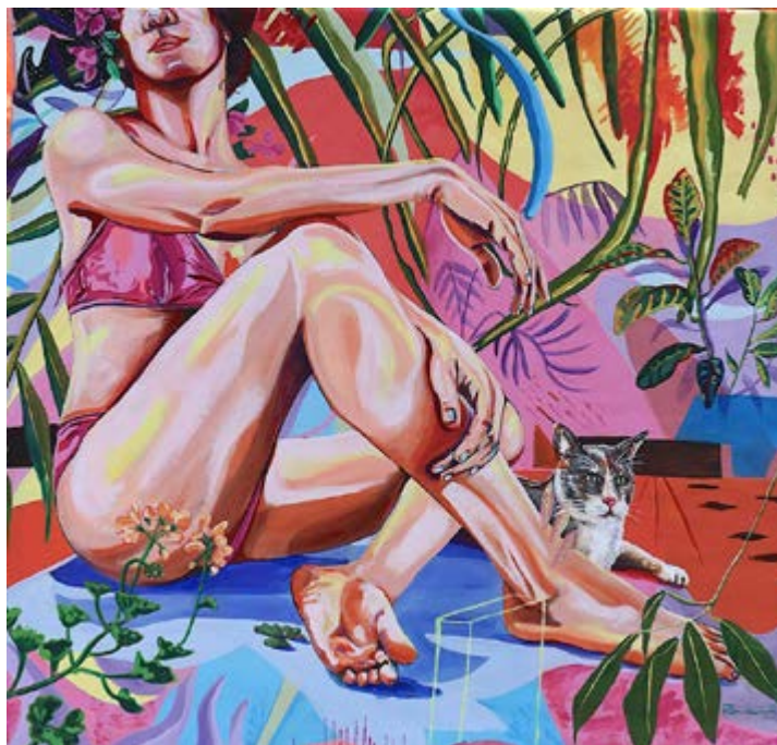
Figura 11 | Lila Jamieson, Bañista y gato , acrílico / lienzo de algodón, 150 x 150 cm, 2023. Imagen cortesía de la artista.

En el ámbito del videoarte, piezas como Arqueología al interior de mí misma (figura 12) están narradas desde una voz neutra y computarizada, pero profundamente íntima. El video habla de mí en tres tiempos distintos: la infancia, al soñar con una compañera; el presente, al construir una casa y una familia con ella; y el futuro, al imaginar el envejecimiento juntas, con to-