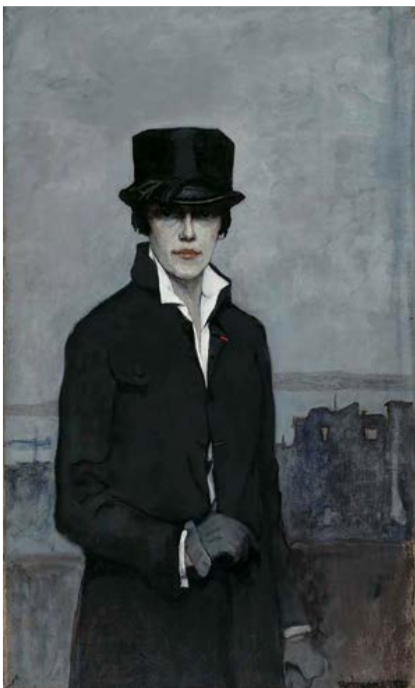
Figura 3 | Romaine Brooks, Autorretrato , óleo/lienzo, 1923, Museo Smithsonian de Arte Americano. https://americanart.si.edu/artwork/self-portrait-2916