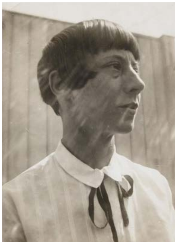
Figura 4 | Hannah Hoch, Autorretrato . https://uninomadasur.net/?p=1455