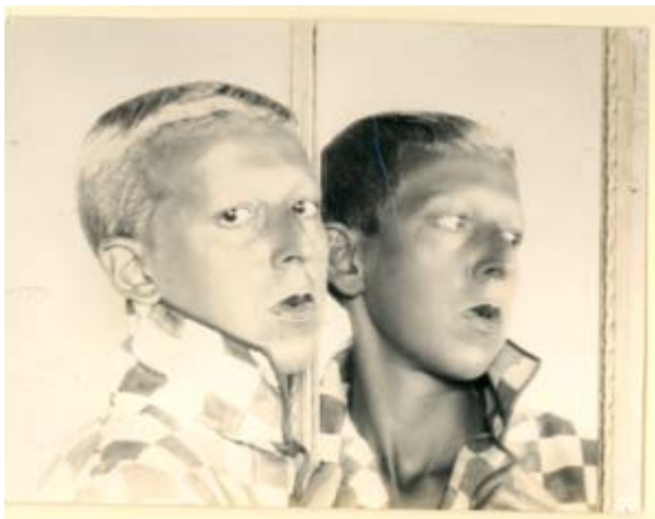
Figura 2 | Claude Cahun. Autorretrato reflejado en un espejo , fotografía. 1928. Universidad de las Artes de Norwich (NUA). https://www.artsy.net/artwork/claude-cahun-self-portrait-1928