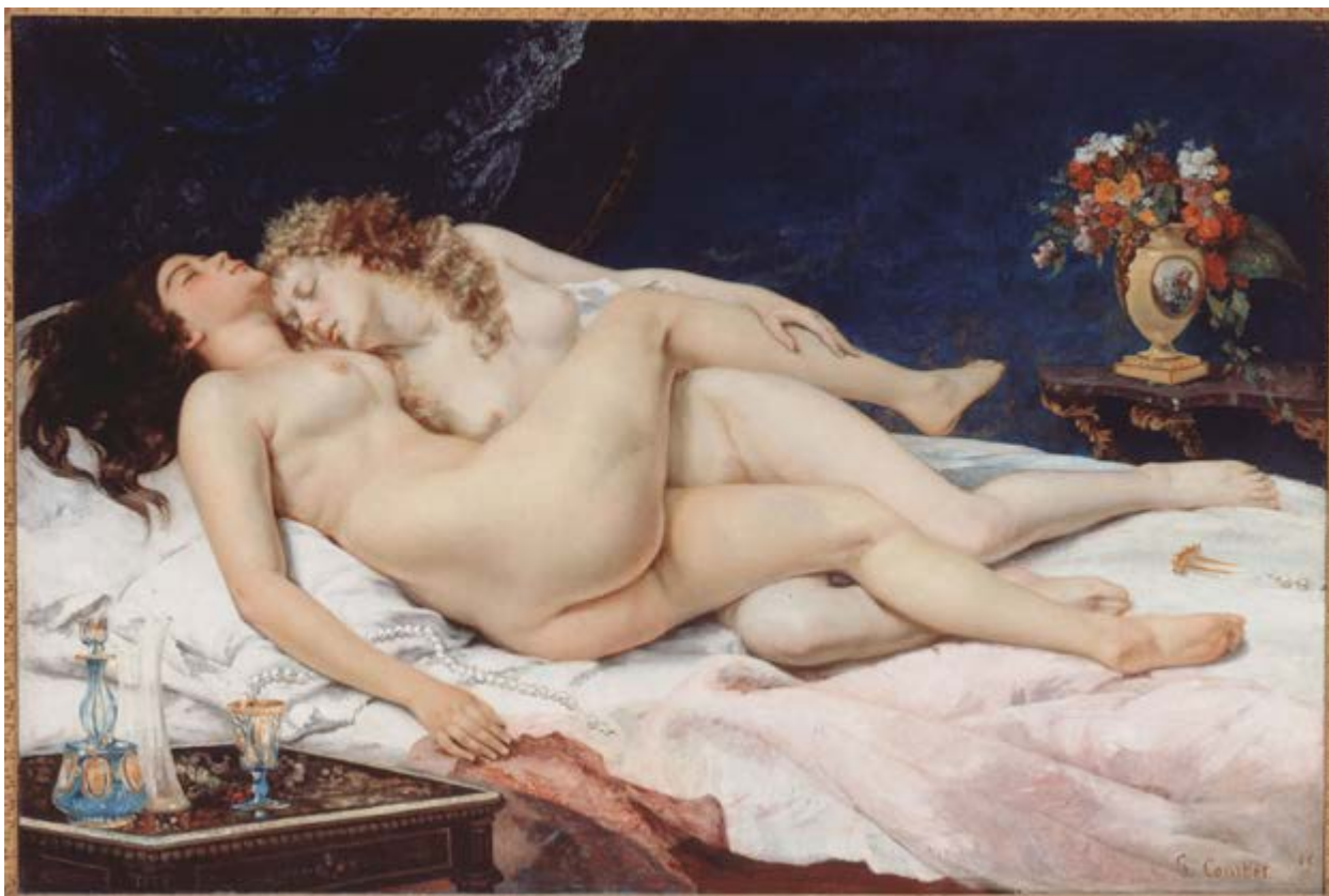
Figura 1 Gustave Courbet. El sueño (Sleep-Le Sommeil) , óleo / lienzo, 135 × 200 cm. 1866. Petit Palais, Musée des Beaux-Arts de la Ville de Paris.*

1890-1918) o Solomon (Londres, 1860-1927) representaron escenas de mujeres en pareja desde una mirada voyerista que convirtió el lesbianismo en un espectáculo erótico al servicio del deseo masculino. Estas imágenes, lejos de visibilizar experiencias lésbicas reales, reforzaron una construcción fetichizada del cuerpo femenino, disponible para el consumo visual, todo un cliché con una narrativa reducida.