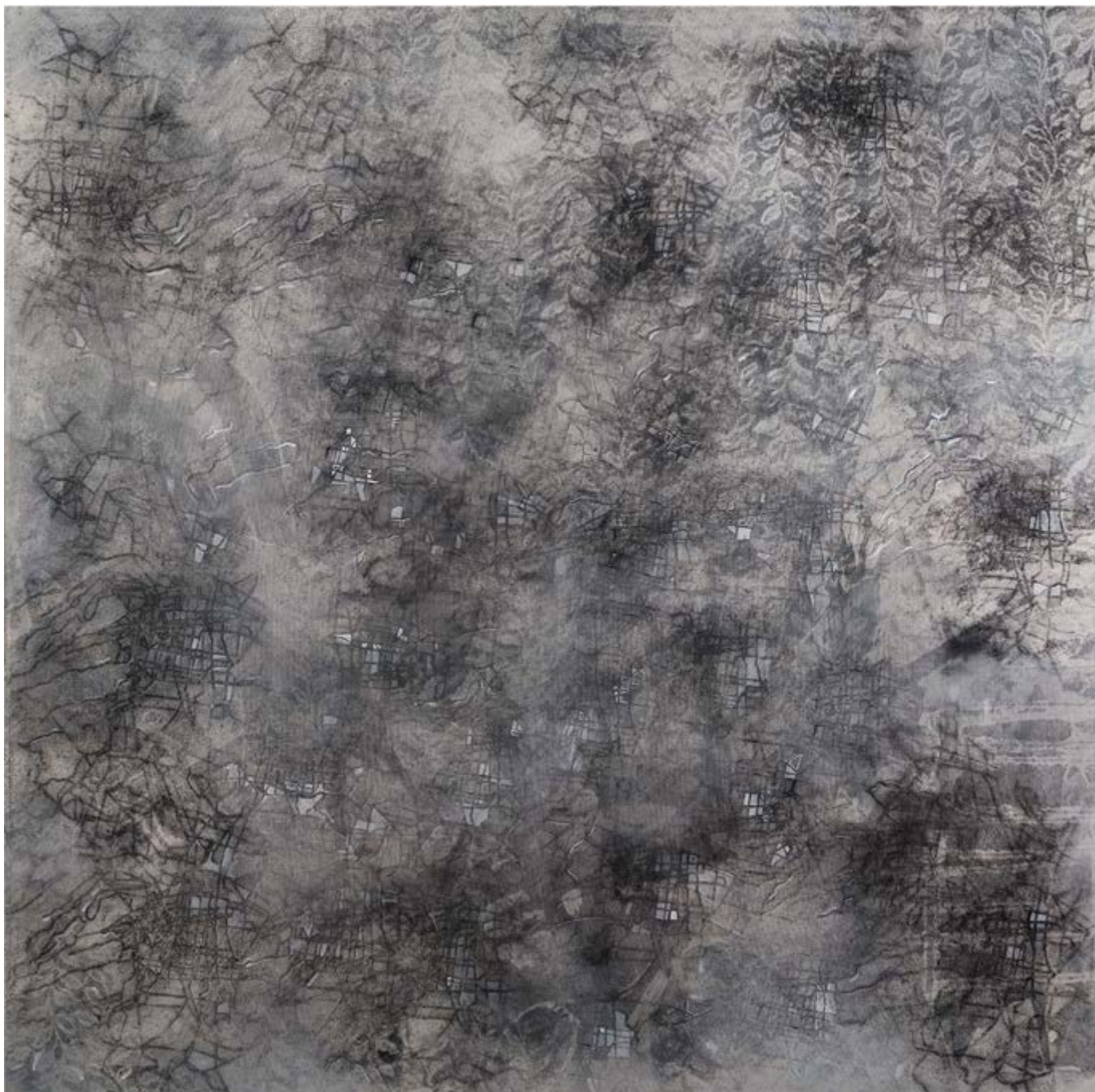
La ciudad futura , 2018, estarcido de pigmento y óleo/tela, 160 × 160 cm