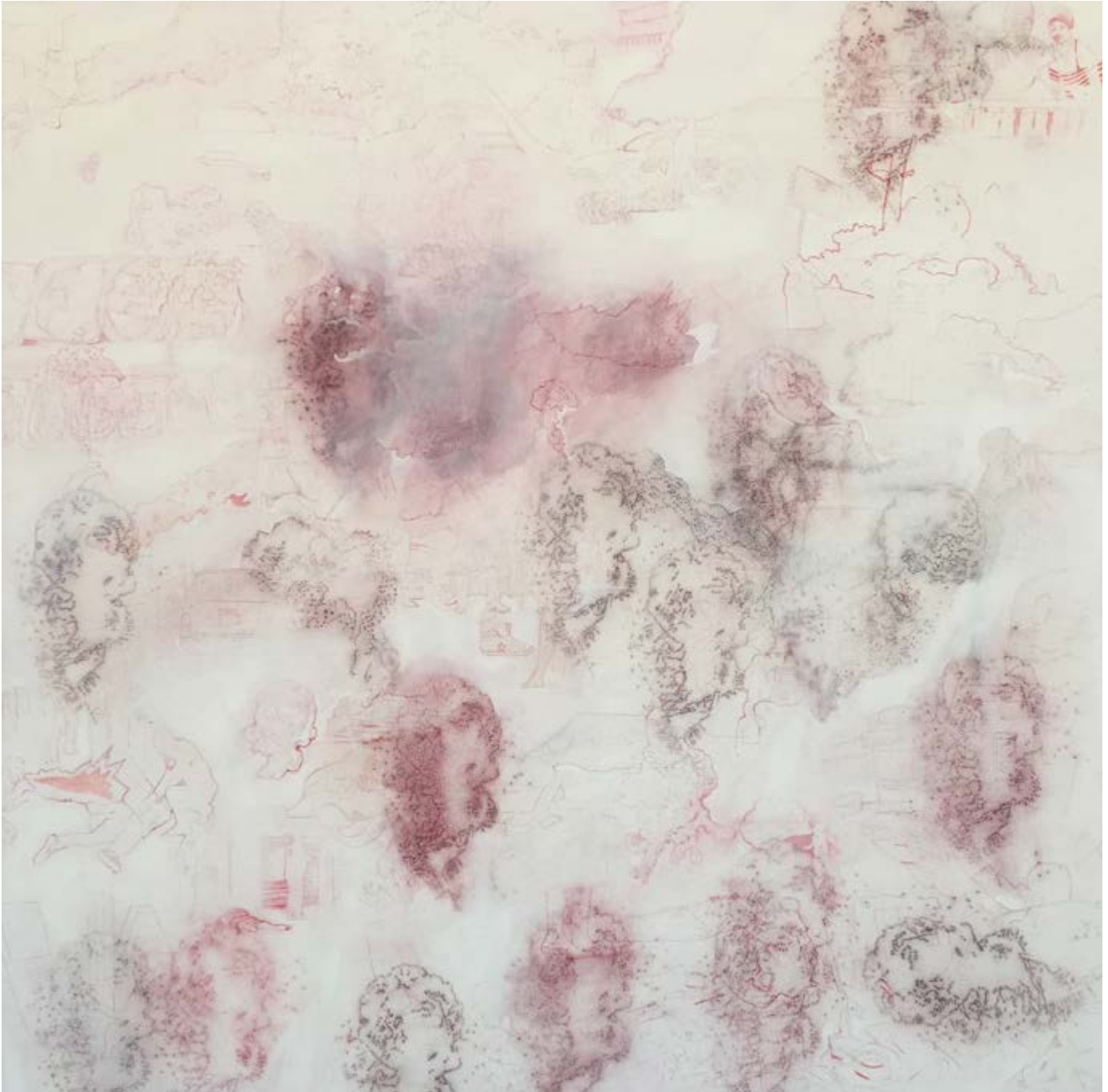
La ciudad futura , 2018, estarcido y óleo/tela, 110 × 110 cm