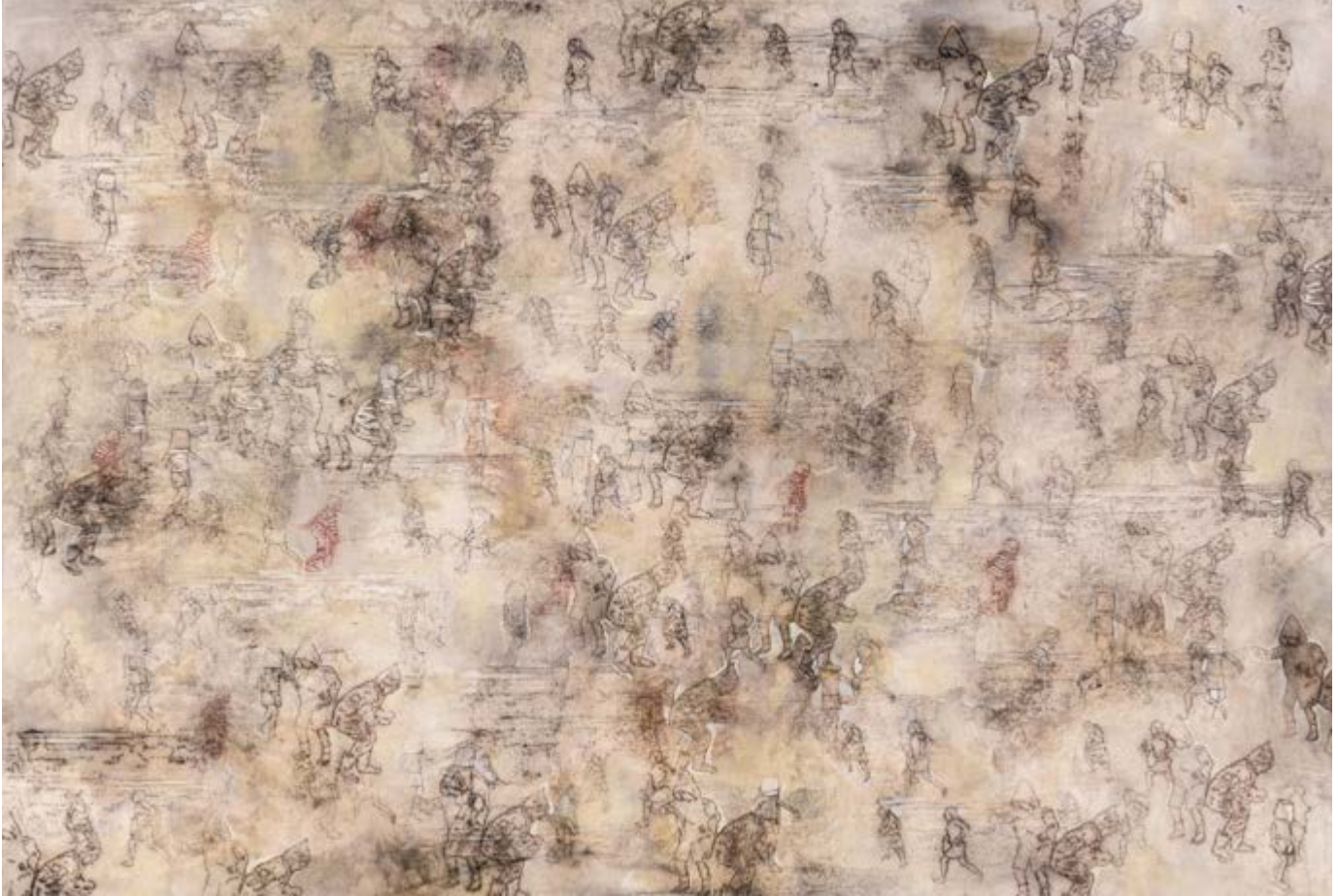
La ciudad futura , 2018, estarcido y óleo/tela, 130 × 160 cm