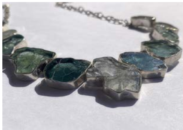
Figura 3 Sublimación , México.

joyería de la serie Sublimación no restaura ni oculta la violencia de origen, sino que la mantiene como una luz tenue pero persistente, una forma de memoria que, al ser portada, continúa afectando y abriendo sentido puesto que son formas que, lejos de desaparecer, persisten como restos, como latencias que reaparecen y afectan en otros tiempos y contextos. Cada fragmento de cristal funciona así como una imagen herida que lleva una memoria fragmentaria, no como representación de un hecho, sino como su persistencia material.