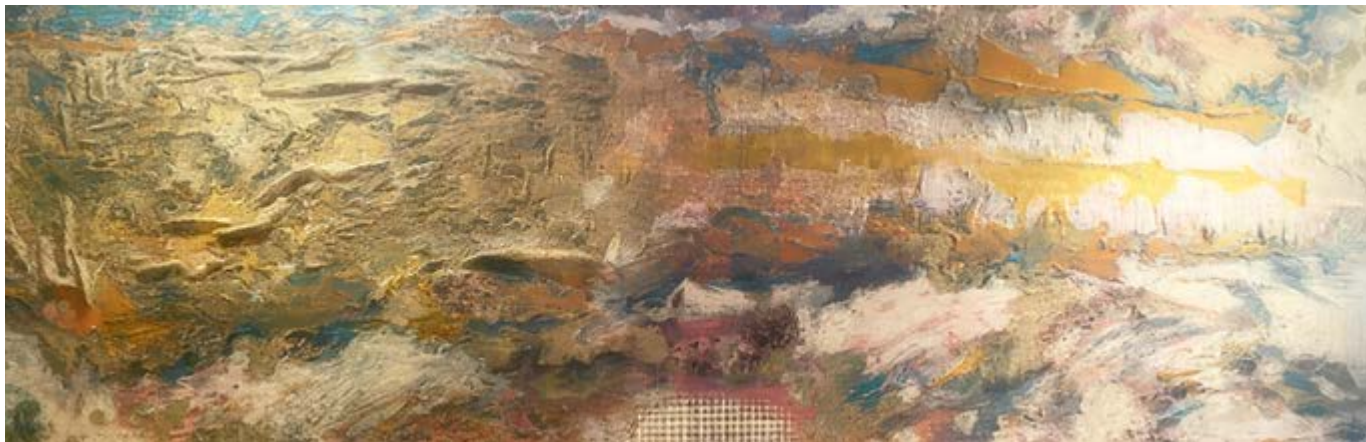
Figura 1 Paisaje imaginario visto a través de un dron, mixta/madera, México.

grantes mexiquenses al atravesar el desierto hacia Estados Unidos.