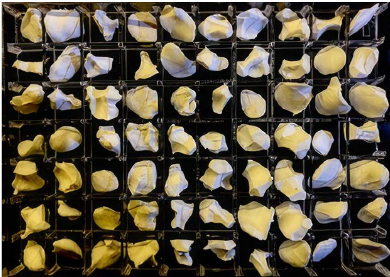
Figura 2 Matríztica , México.

el calor que queda en la silla al levantarse, el roce de dos labios al separarse. La fragilidad del gesto leve se vuelve testimonio de un mundo que aún busca cómo tocarse.