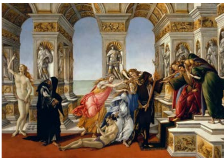
Figura 7 | Sandro Botticelli, La calumnia de Apeles , temple / tabla, 62 × 91 cm, 1495. Galería Uffizi, Florencia, Italia. https://commons.wikimedia.org/wiki/File:Sandro_Botticelli_La_calumnia_de_Apeles.jpg

Regresando al libro de Adam, vale la pena recordar que para el autor, el calumniador recurre a dos estrategias: manipular el lenguaje y utilizar principios morales como telón de fondo. Estos principios le ayudan a establecer un orden que, en realidad, es inmoral. Su intención es que la víctima pierda todo valor moral y acabe desesperada. La relación entre el calumniador y