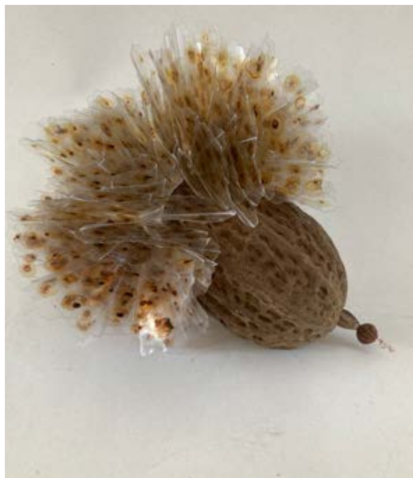
Cacao , 2023, PVC y semilla de cacao, 20 × 32 × 29 cm