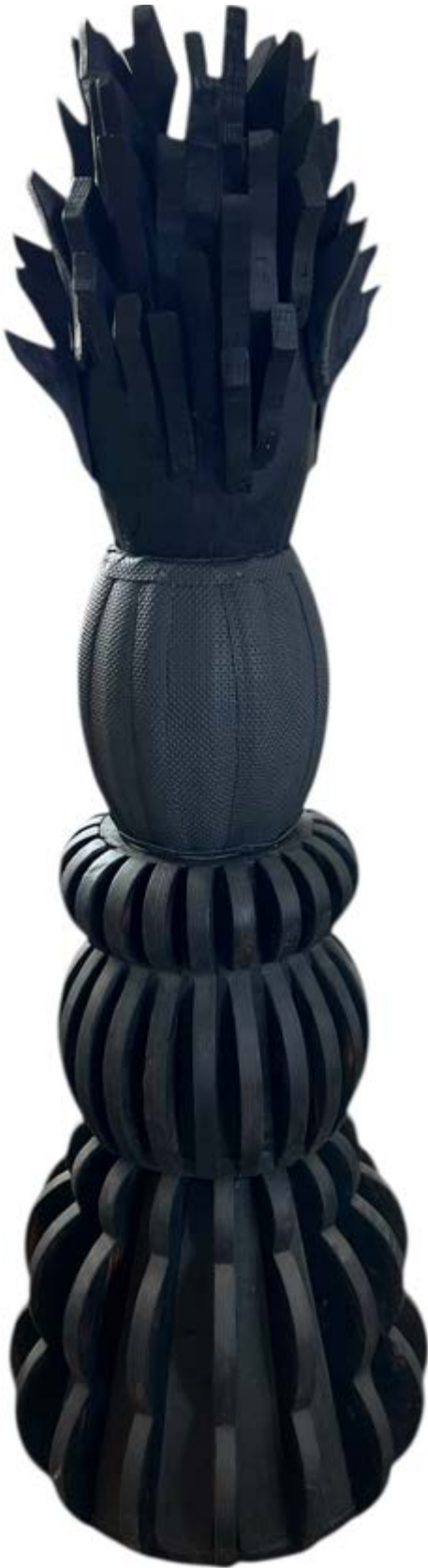
Piña , 2023, madera, mixta, 135 × 50 × 50 cm