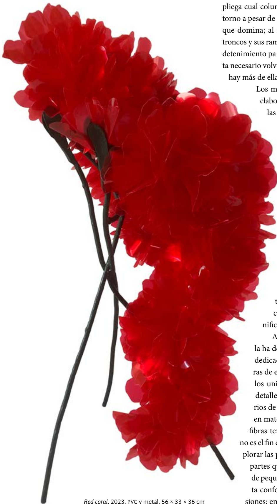
Red coral , 2023, PVC y metal, 56 × 33 × 36 cm

pliega cual columna y ofrece un contraste con el entorno a pesar de sus referentes orgánicos. Pero el bosque domina; al final el conjunto se funde entre los troncos y sus ramas. Por momentos hay que mirar con detenimiento para ubicar las esculturas; a veces resulta necesario volver a recorrer el lugar tras advertir que hay más de ellas entre los árboles.