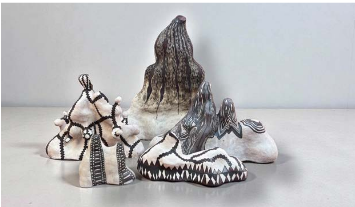
Montañas , 2025, barro y engobe, medidas variables