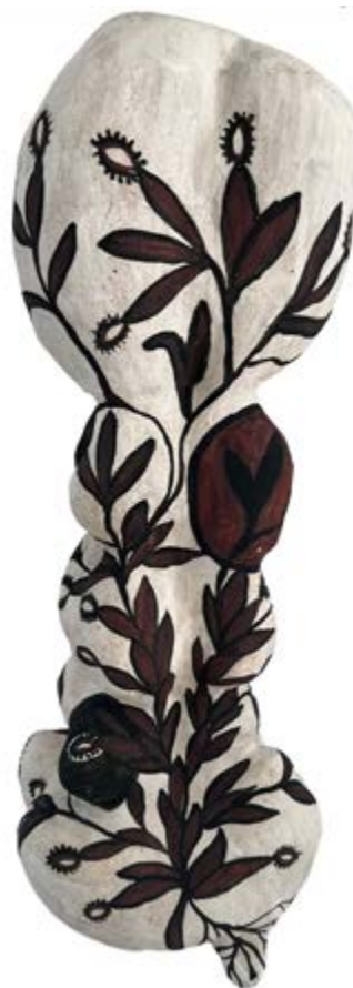
Inventario natural , 2024, barro y engobe, 51 × 19 × 17 cm