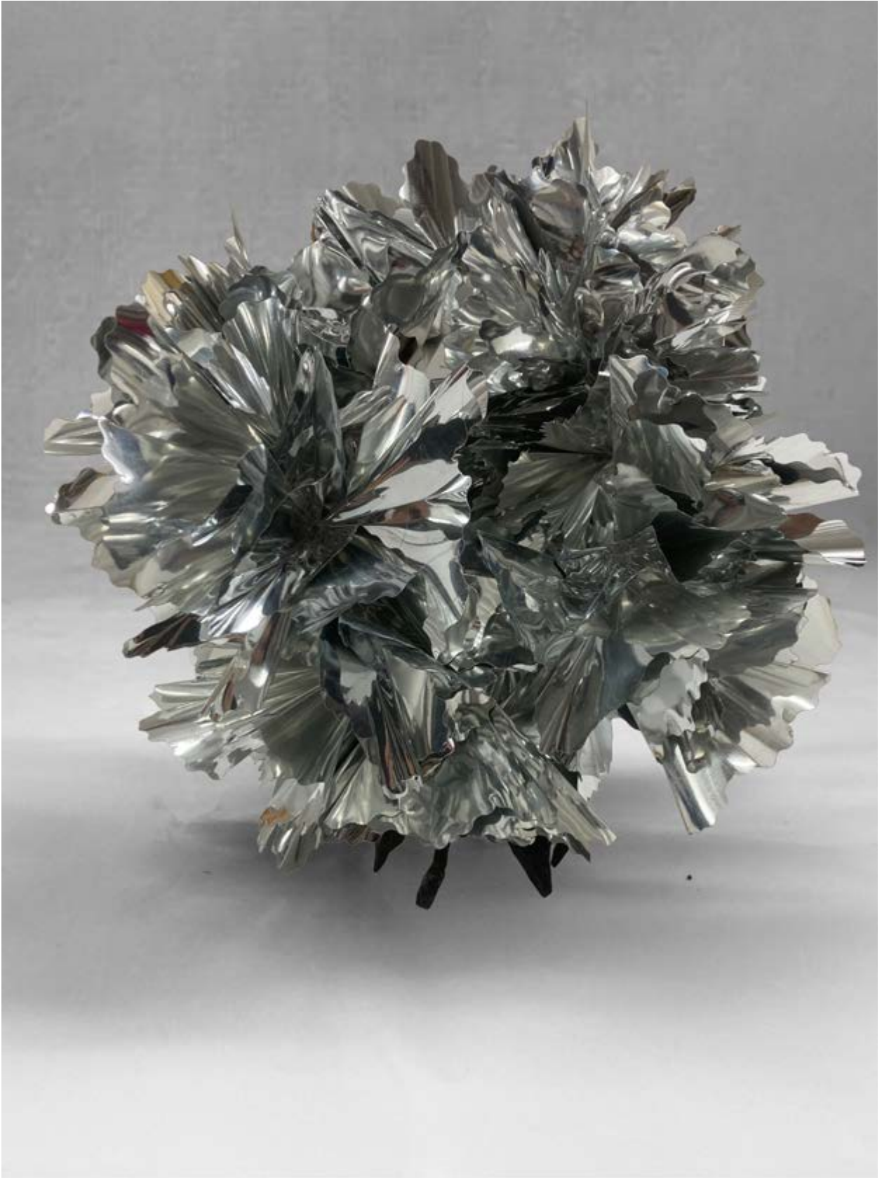
Planta plateada , 2022, PVC, 27 × 27 × 27 cm