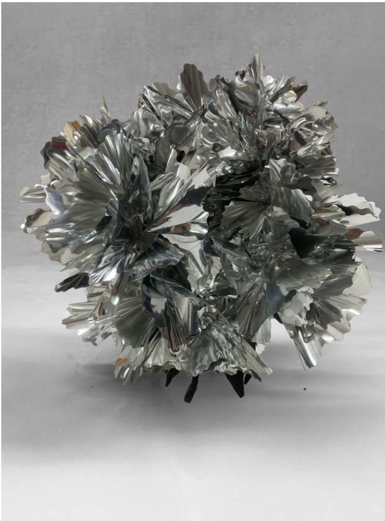
Planta plateada , 2022, PVC, 27 × 27 × 27 cm