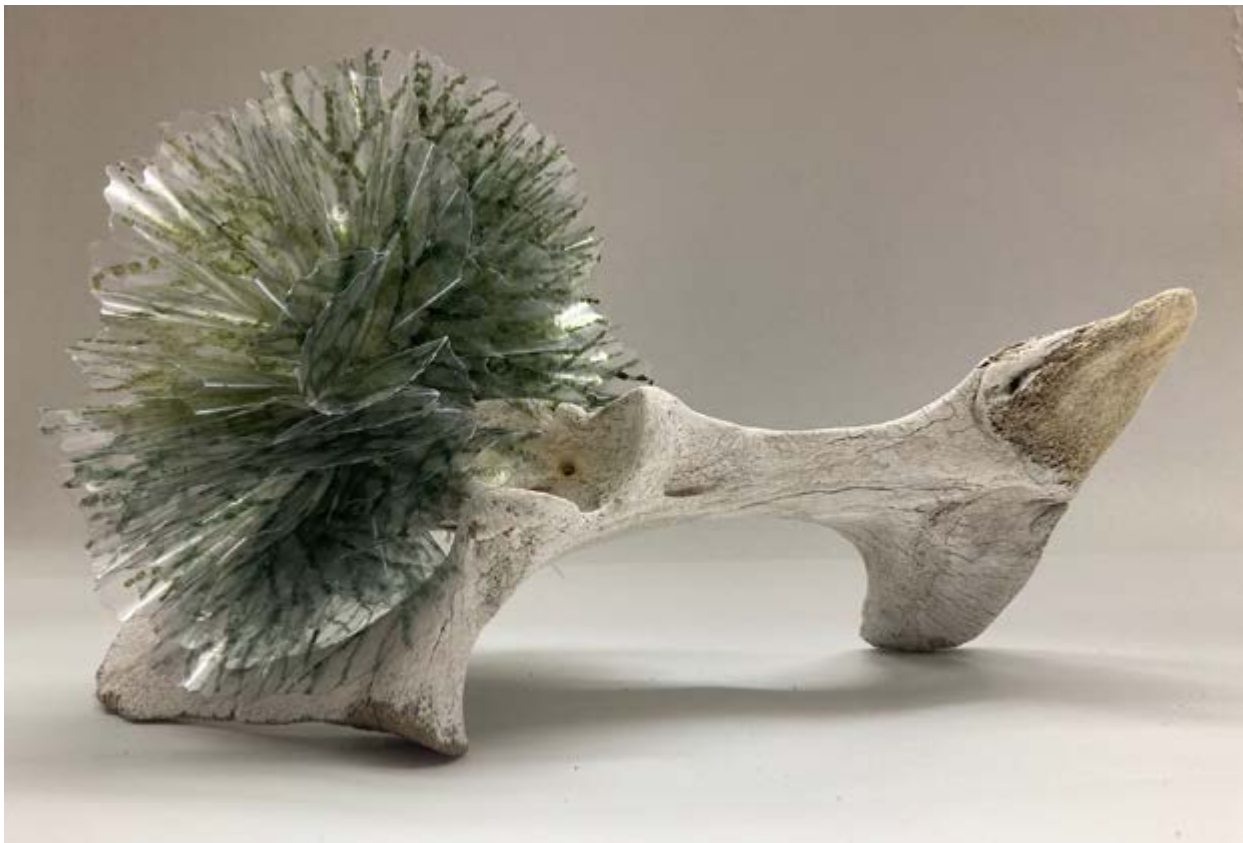
Retoño, 2022, PVC y hueso, 23 × 38 × 21 cm

escala. En ambas proporciones, la textura del material, su color, así como otras cualidades formales son clave para establecer una correspondencia armónica entre las diferentes partes de la escultura y que funcionen como un todo integrado. Ese principio anima a este conjunto de obra que se desenvuelve a través de la variación y la repetición de elementos comunes, hasta desplegar un bosque de estructuras que son familiares entre sí, pero únicas según el resultado de la combinación de las partes elegidas.