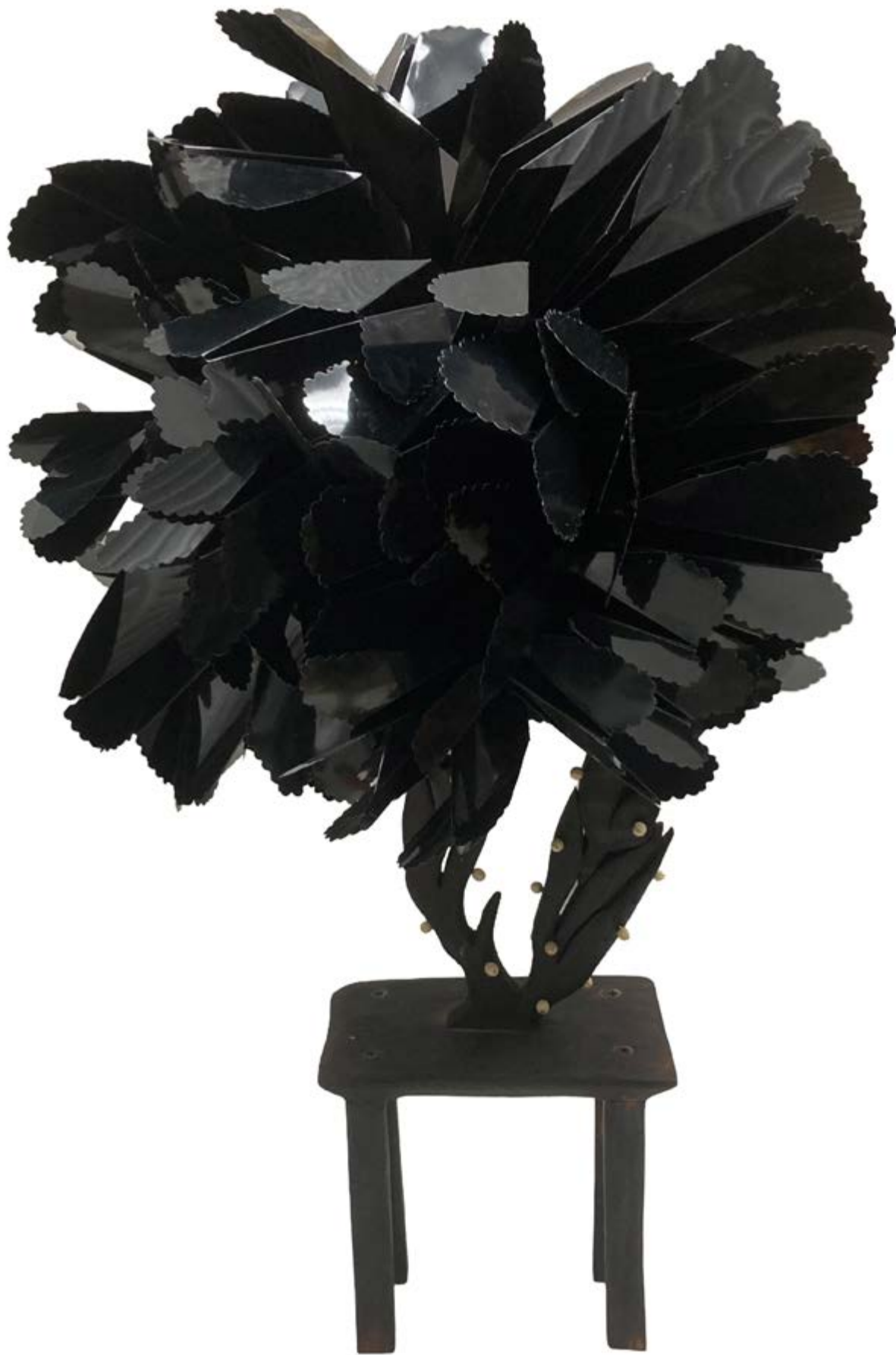
Talofita , 2022, madera, hueso y PVC, 59 × 38 × 34 cm