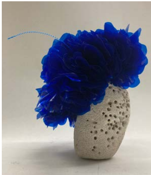
Briozo , 2024, PVC y coral natural, 30 × 17 × 18 cm