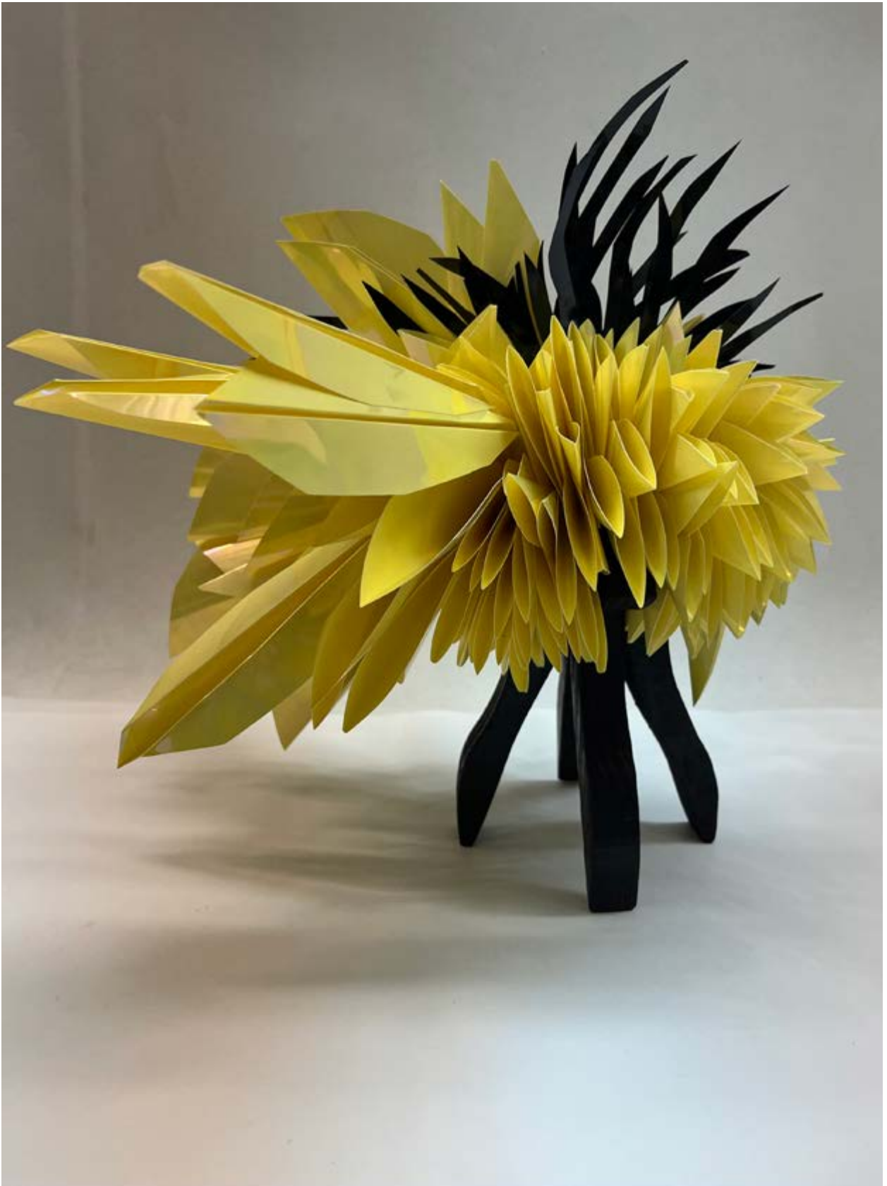
Floración , 2024, PVC y madera, 30 × 30 × 30 cm