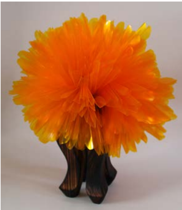
Briozo naranja , 2022, PVC, 40 × 30 × 30 cm