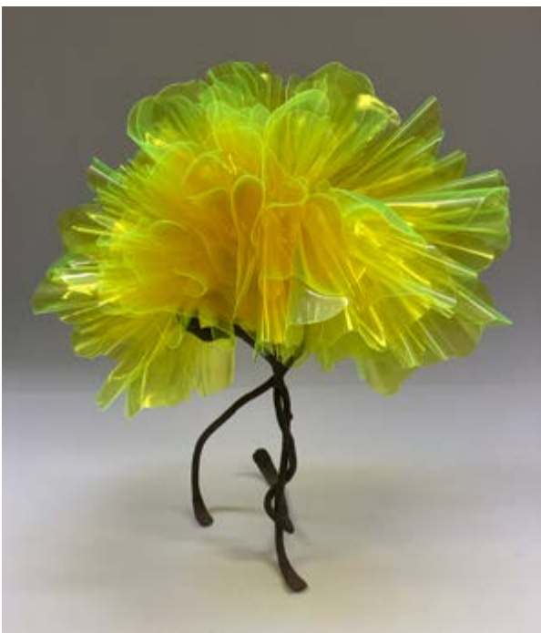
Brote , 2023, plástico y metal, 28 × 33 × 24 cm