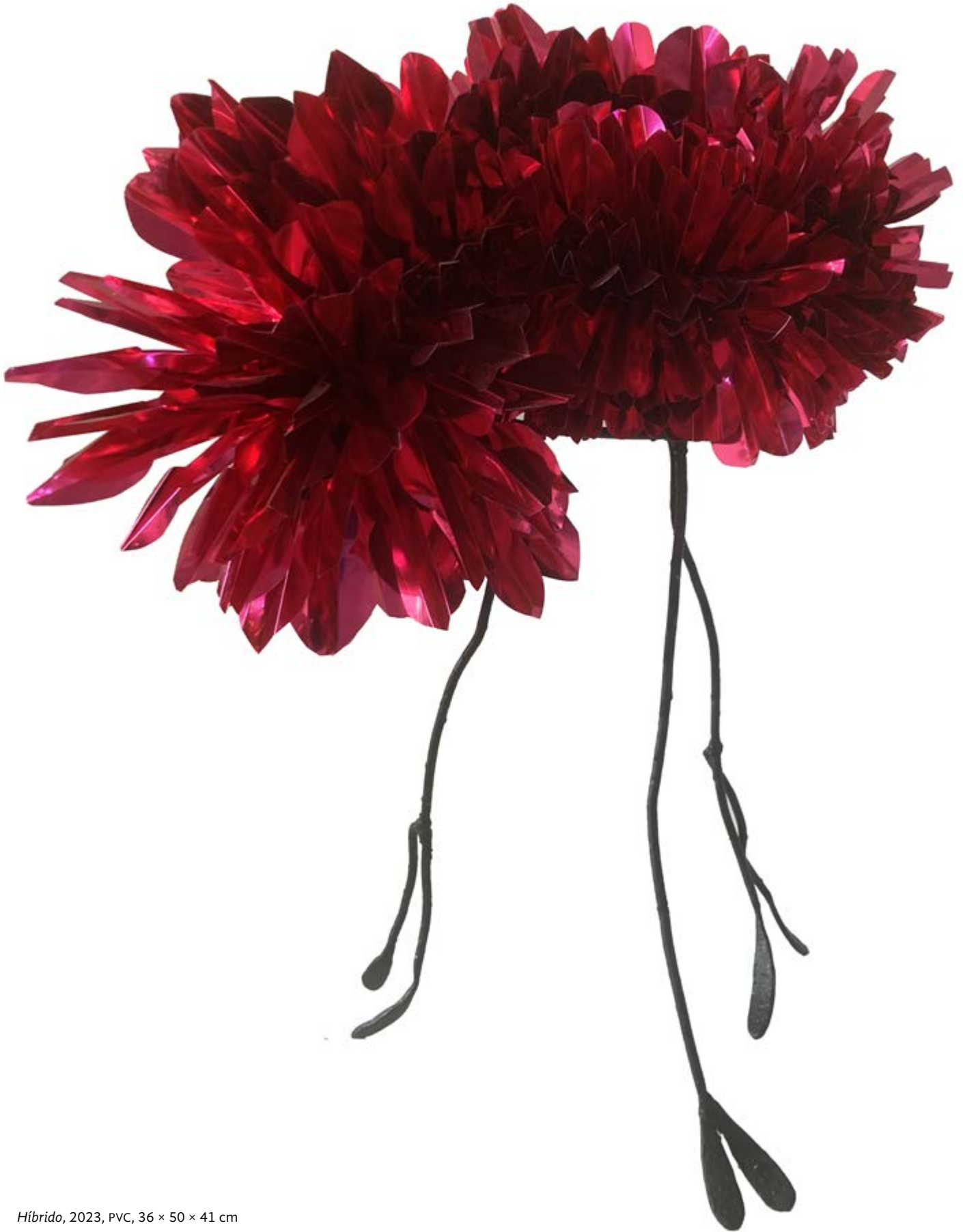
Híbrido , 2023, PVC, 36 × 50 × 41 cm