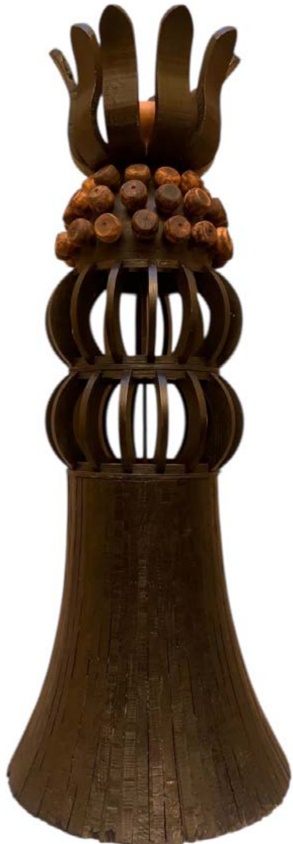
Híbrido II , 2021, madera, 165 × 67 × 67 cm