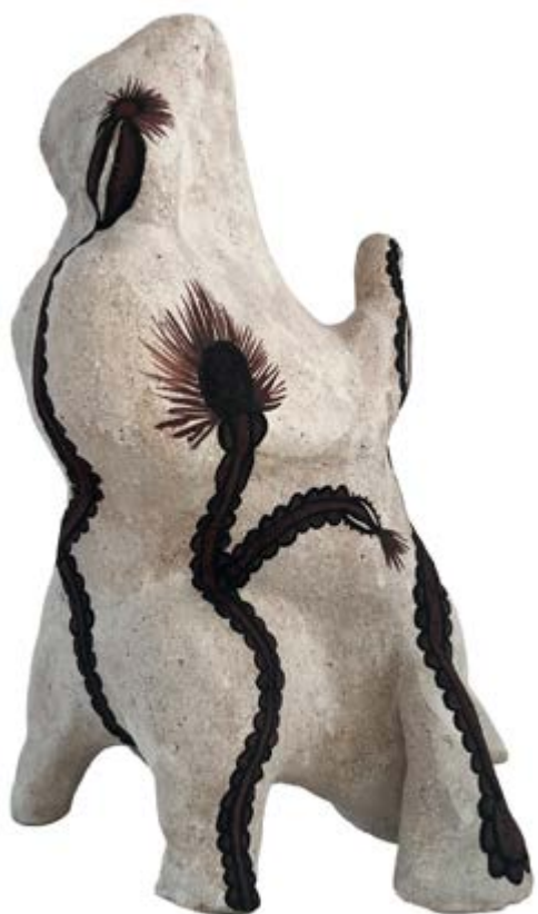
Código natural , 2025, barro y engobe, 35 × 28 × 22 cm