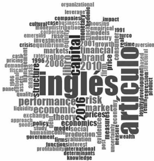
Figura 2. Palabras clave, género documental, idioma y quinquenios predilectos en las referencias utilizadas para la investigación sobre teoría del valor en el 2019