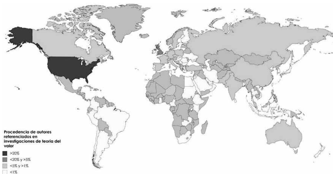
Figura 3. Procedencia de autores referenciados en investigación sobre teoría del valor en el