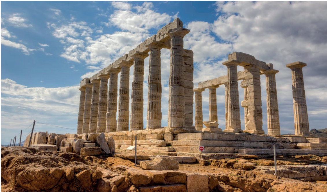
Cabo de Sounion, al sur de Atenas, y punto de reflexión para la República de Platón, construido entre 444–440 a. C.