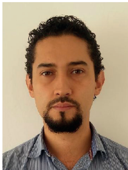
Fotografía de Joaquín Valderrama.