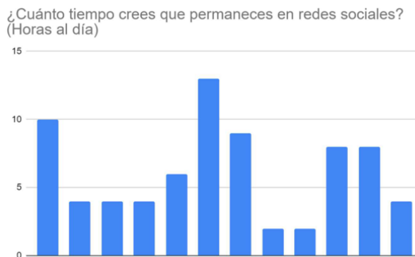
Figura 2. Tiempo que permanece en redes sociales al día

Se considera por cuanto menos curioso el resultado a esta pregunta, debido a la variedad de respuestas obtenidas. El promedio de horas fue 5.4, lo cual conforma gran parte del día de una persona, y evidencia nuevamente la relevancia que tienen las redes sociales en las personas, en este caso, jóvenes de secundaria.